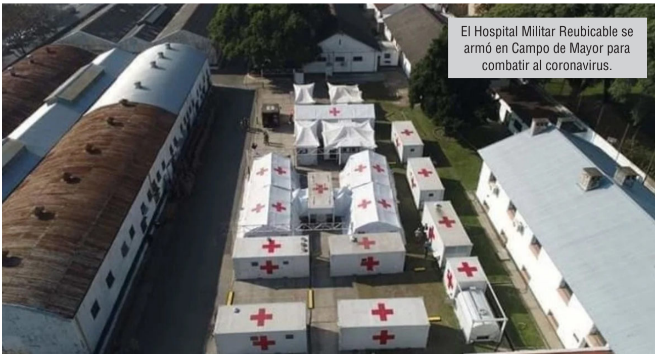
El Hospital Militar Reubicable se armó en Campo de Mayor para combatir al coronavirus.