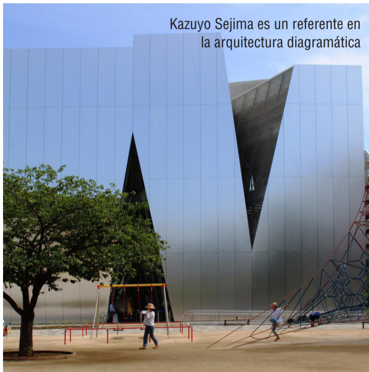
Kazuyo Sejima es un referente en la arquitectura diagramática

Con motivo del 8 de marzo recordamos la importancia que han tenido las mujeres en la historia de la arquitectura y del diseño enumerando once nombres (aunque la lista bien podría ser mucho más larga) cuyo trabajo marcó un antes y un después en la historia de estas profesiones.